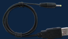
P25AMTDC60 (USB-5VDC 電源ケーブル) x1