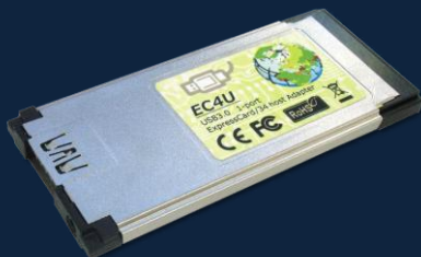
EC4U (USB3.0 ExpressCard34 アダプタ) x1